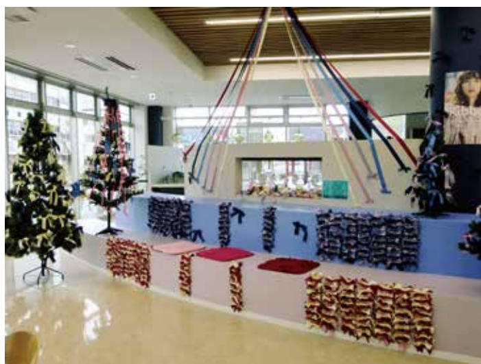
Ribbonの森をイメージした装飾（YOMUNOSU）