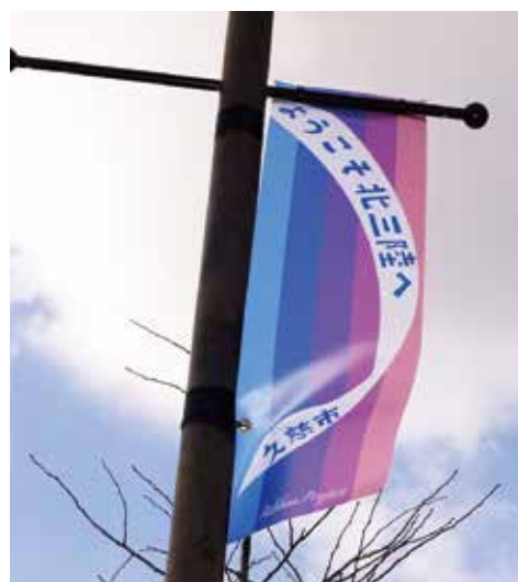
このフラッグが観光客をお出迎えます