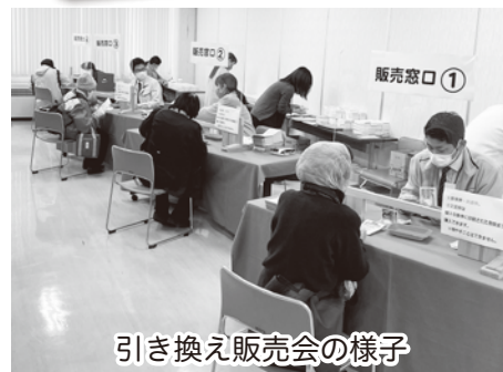
引き換え販売会の様子