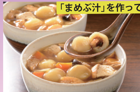
「まめぶ汁」を作ってみよう!

ドラマでは微妙な味と言われた「まめぶ汁」ですが、どんな味なのかは、実際に皆さんが手作りして味わってみてください。